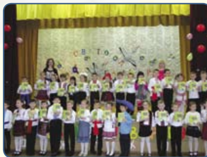
Учні 1-Б класу