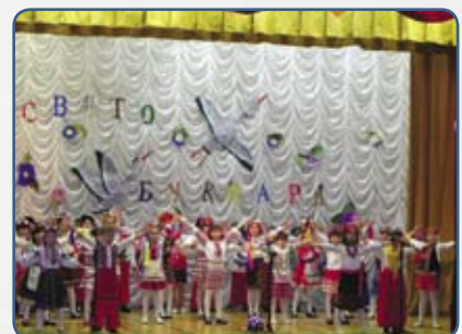
Учні 1-Д класу

Наш буквар, добру книжку найпершу, З хвилюванням мій клас пізнавав. І раділи ми щиро, хто звершив — І цю книжку для нас написав. Тридцять три чудернацькі гачечки Розійшились по його сторінках. Танцювали крапки і кружечки У здивованих наших очах.