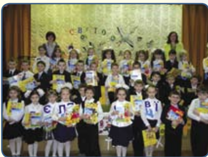
Учні 1-А класу