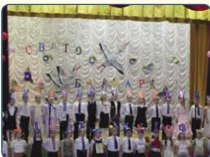
Учні 1-Г класу

Наш буквар, добру книжку найпершу, З хвилюванням мій клас пізнавав. І раділи ми щиро, хто звершив — І цю книжку для нас написав. Тридцять три чудернацькі гачечки Розійшились по його сторінках. Танцювали крапки і кружечки У здивованих наших очах.