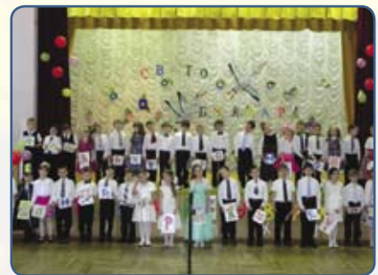
Учні 1-В класу