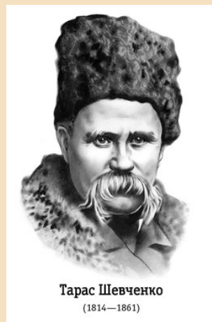
Тарас Шевченко (1814—1861)

9 березня – День народження Тараса Григоровича Шевченка.