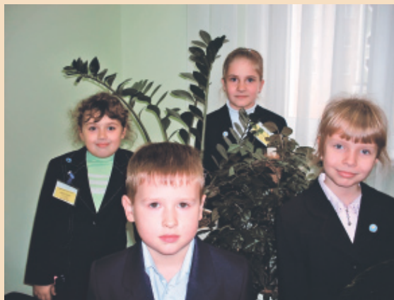
Учні 3-Г класу