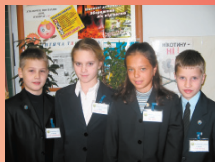
Учні 4-В класу

Білий зошит всередині, На обкладинці – картини Ще всередині – поля, Мов веселі тополя! А іще клітини сині, Мов річки, ставки, моря. Ось така весела в мене Ця фантазія моя!