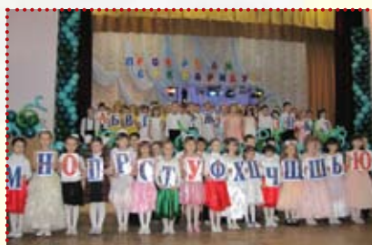
Учні 1-В та 1-Є класів

21 квітня учні 1-В та 1-Є класів підготували великий святковий концерт у актовій залі гімназії. Діти, як справжні актори, перевтілюва- лись з однієї ролі в іншу. Вони пока- зали виставу, де головними героями були Буквар, Шапокляк, Лівинця та букви. Розказували вірші, співали, танцювали, відгадували загадки. Всі глядачі були в захваті від такого дійства.