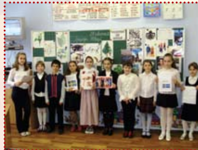
Подорож до Швеції 4-Г

разом із вчителями здійснили віртуальну подорож до Скандинавії. Завдяки мультимедійній системі