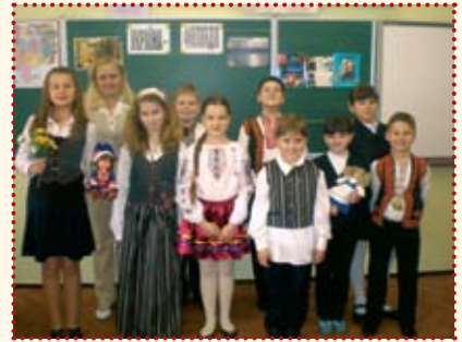
Подорож до Фінляндії 4-В

разом із вчителями здійснили віртуальну подорож до Скандинавії. Завдяки мультимедійній системі