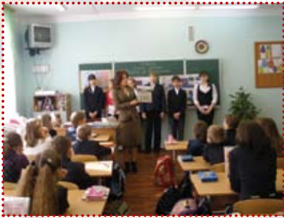
Подорож до Данії 4-А

Вже стало традицією проводити у початковій школі свято «Подорож до Скандинавії».