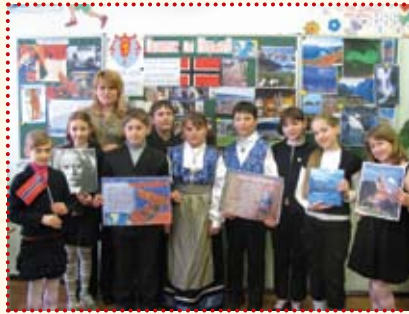
Подорож до Норвегії 4-Б