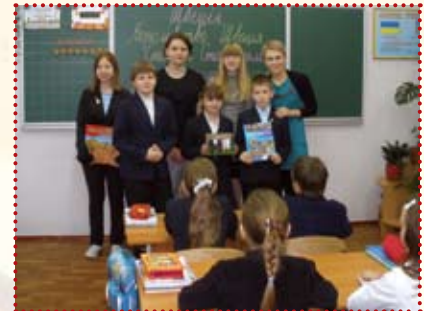
Подорож до Швеції 4-Є

діти побачили незвичайні місця, чудові краєвиди далеких північних країн.